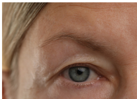
Før direkte øjenbrynsløft